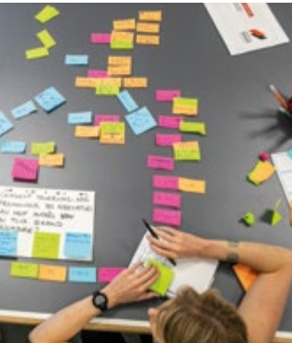
Design de services