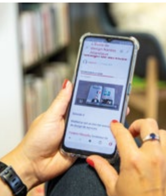
E-learning Design Thinking